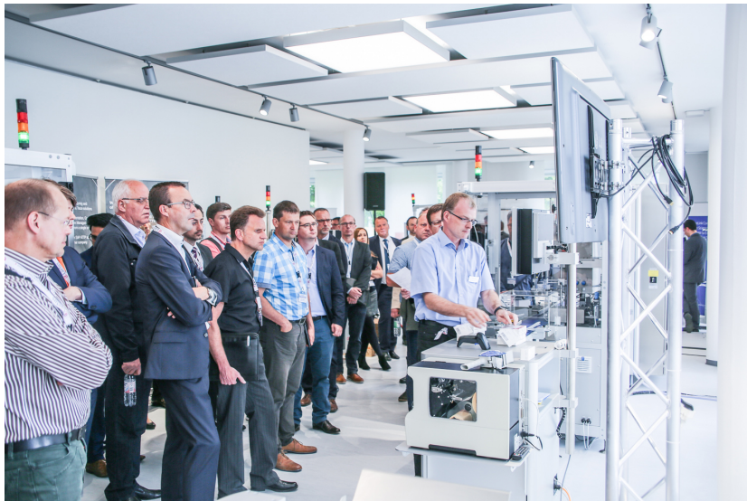
Live Demonstration im Showroom der Track & Trace Academy